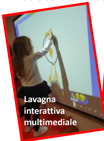
Lavagna interattiva multimediale