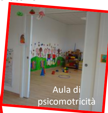
Aula di psicomotricità

Aula multimediale con LIM e tavolo luminoso